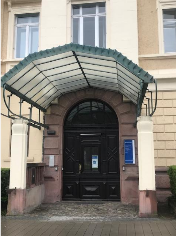
Abbildung 3: Haupteingang Werthmannstraße