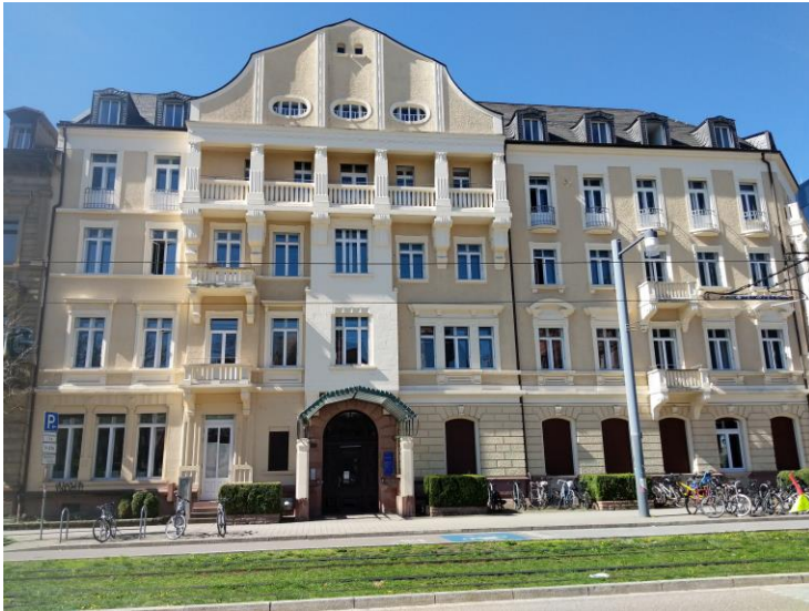
Abbildung 1: Werthmannstraße