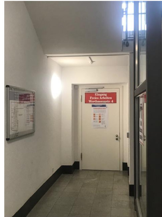
Abbildung 5: Durchgang zu den Poolräumen