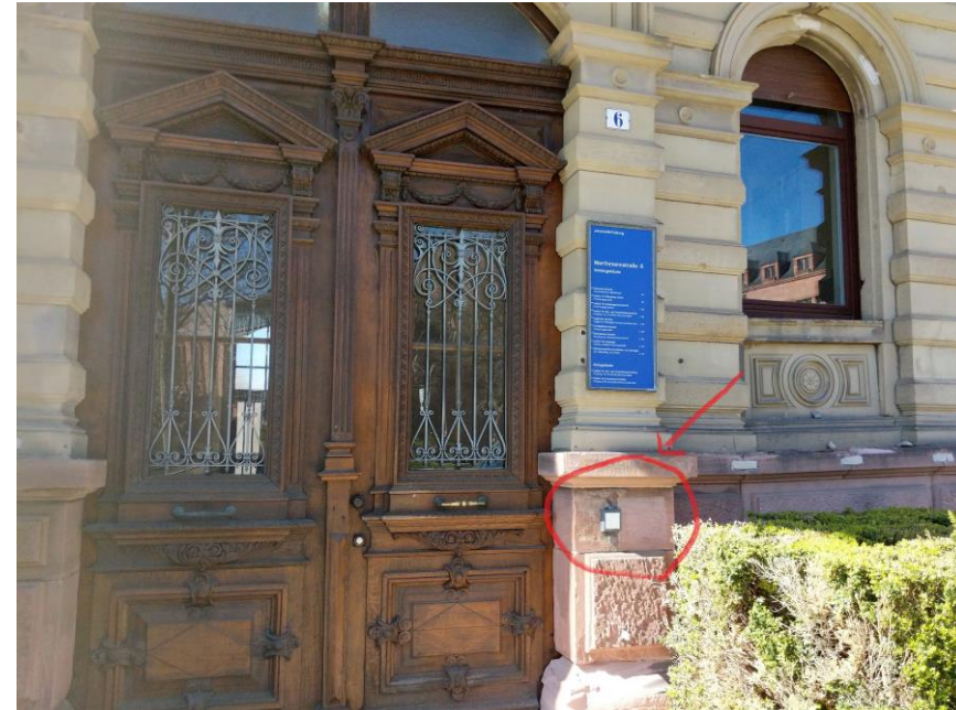
Abb. Haupteingang der Werthmannstr. 6 mit Aktivierungsgerät rechts neben der Tür

Außerhalb der Öffnungszeiten lässt sich der Transponder am Aktivierungsgerät an der Werthmannstr. 6 (siehe Abb. rechts) aktivieren.